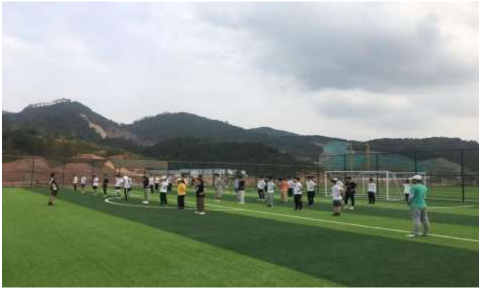
图 2 罗明老师的足球课