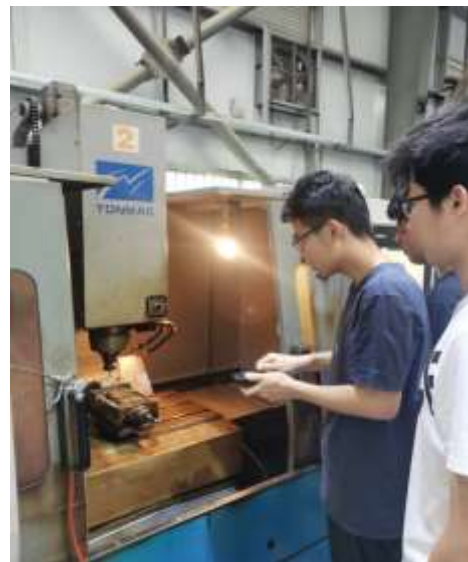
图4 白云校区实训现场