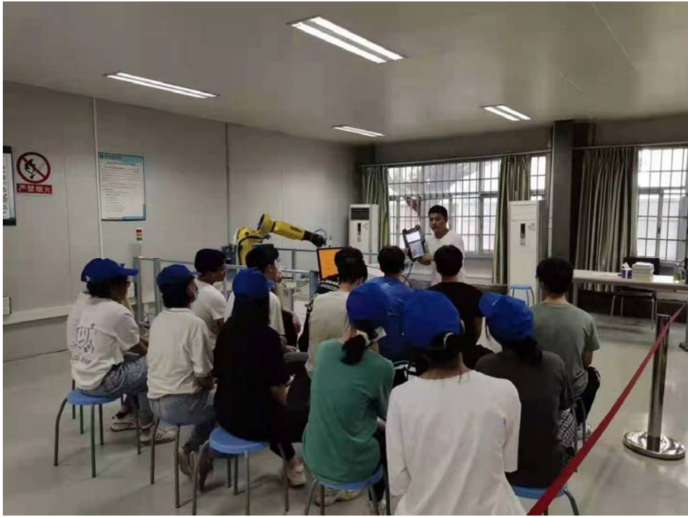
图 5 集中讲解