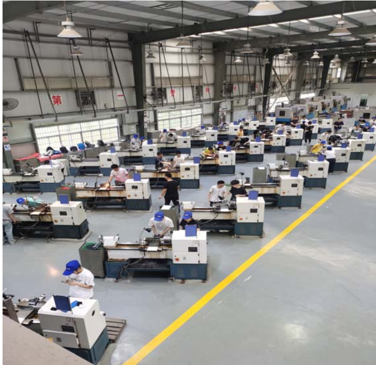
图 7 上机操作