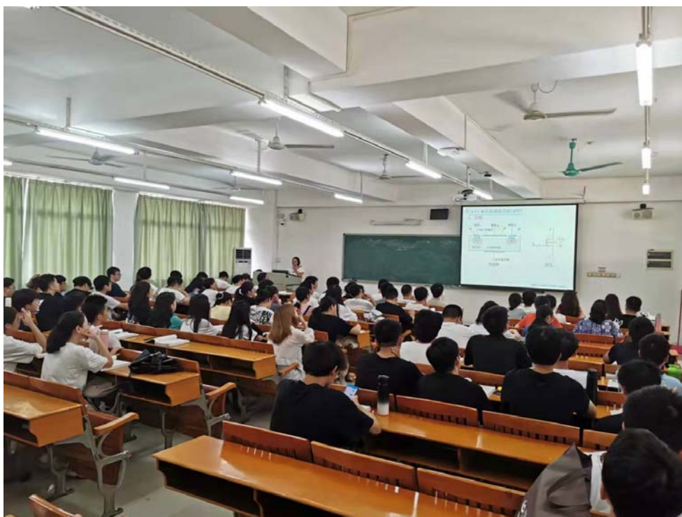
图 3 蒋争明老师在授课