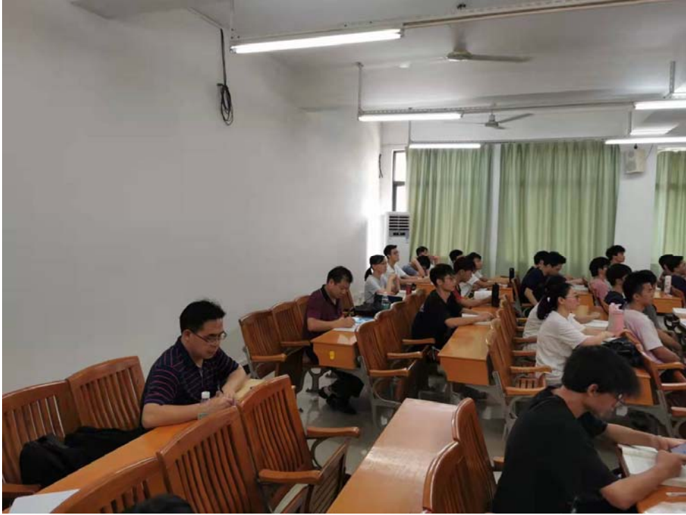
图 4 大电类教学部老师们在听课

智能制造训练部被听老师中有 2 名是近两年的新进教师，其余 6 名都是经验丰富的中青年骨干教师。骨干教师们工作态度积极热情，讲课逻辑性好、条理清晰、对课程内容娴熟。新进教师讲课水平明显提高，进步很快。能够针对课程重点、难点进行详细讲解。能够调动学生的学习兴趣，课堂气氛活跃，整体教学效果好。