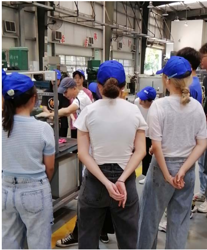
图 6 操作展示