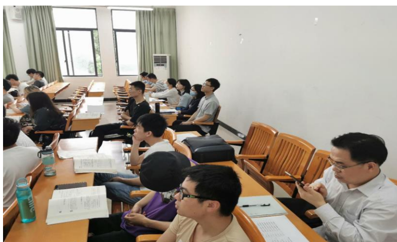
图 3 听课教师在听评课并在手机上填听课评价