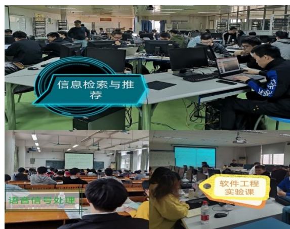
图 1 抽查听课的情况