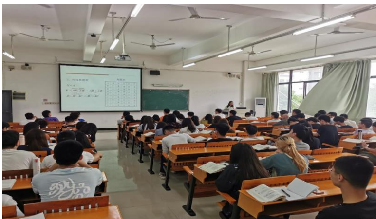
图 2 蒋争明博士在讲授《数字电子技术》课程