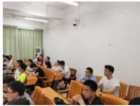
图 3 同行在听课