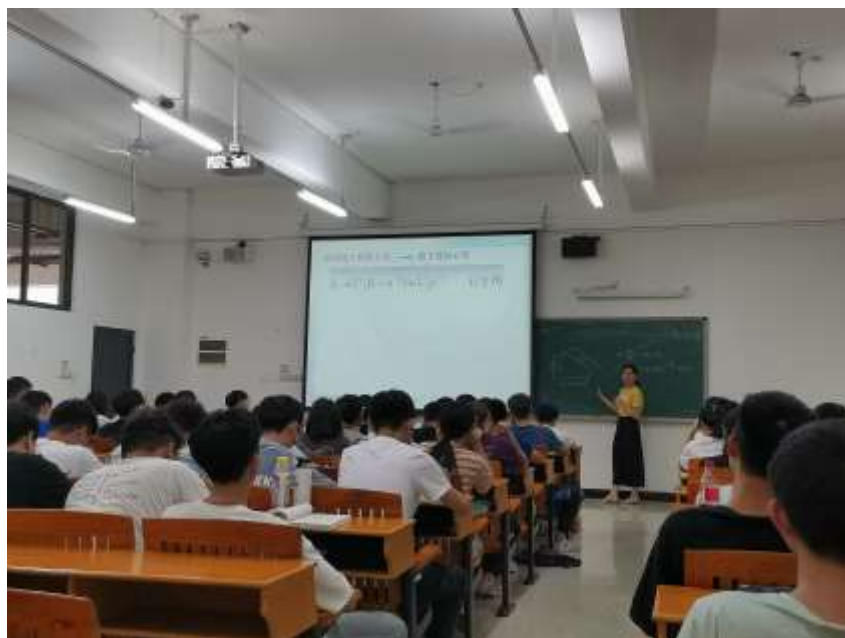
图 1 洪晔博士在讲授《电工电子技术》课程

课教师授课活动。通过本月听课活动的开展，不仅让老师提高认识，把努力提升本科课堂教学质量作为第一要务，也让全体课任教师参与听课评课活动，形成课堂教学以评促改的良性循环。