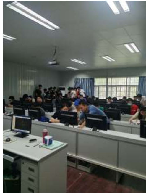
图 4 白云校区实训现场